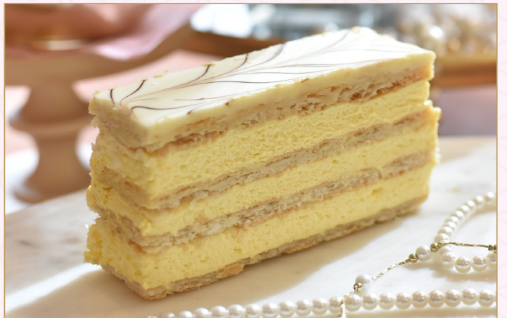
ميل فوي الكريمة (Calories 230) 32 S.R. MILLE FEUILLE 32 S.R.