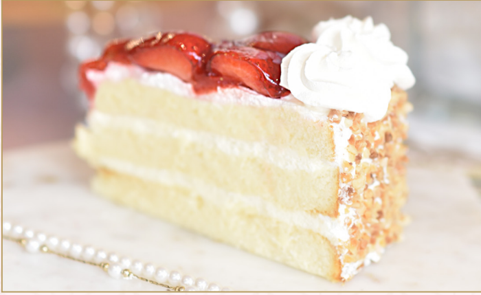
كـيكة الفـراولة (Calories 230) 32 S.R. STRAWBERRY GATEAUX 32 S.R.

رغيف الفانيلا الرقيق مع الفراولة الطازجة والكريمة