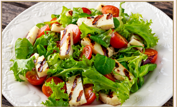
سلطة الحلومي (Calories 700) 68 S.R HALLOUMI SALAD 68 S.R

خس مشكل مع الروكا و التين و قطع اليقطين المشوي