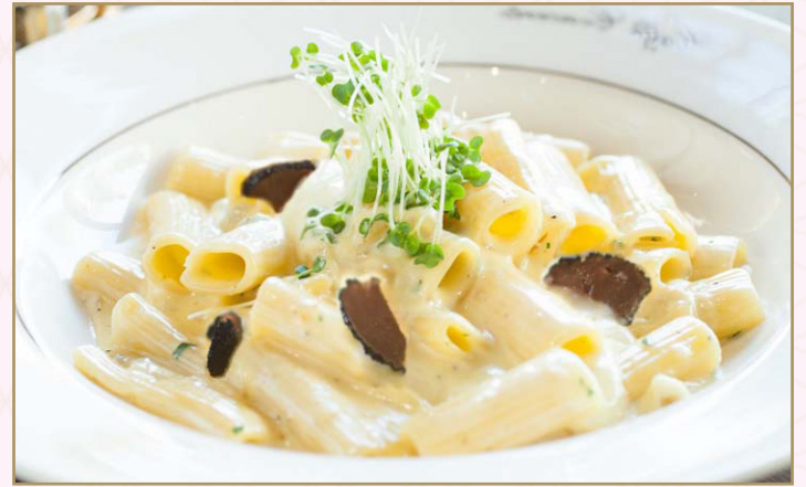
معكرونة ريجاتوني بصلصة الفوندو والتفرفل (Calories 1120) 76 SR RIGATONI TRUFFLE FONDUE 76 SR معكرونة ريجاتوني بصلصة الفوندو والتفرفل والفطر البري مع صلصة الفوندو الغنية بالتفرفل