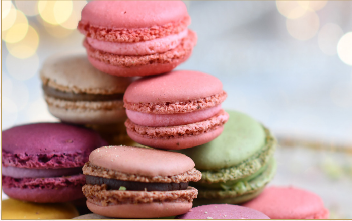
ماكارون (Calories 240) 24 S.R. MACARONS 3 pieces 24 S.R.