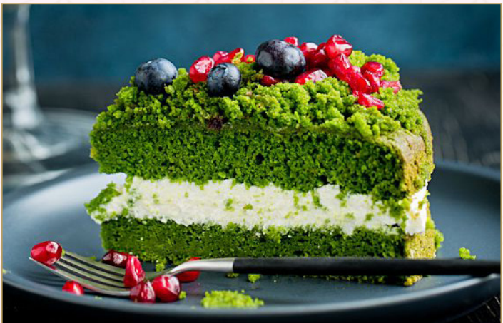
كيك الماتشا والكرز (Calories 140) 32 S.R. MATCHA CHERRY CAKE 32 S.R.