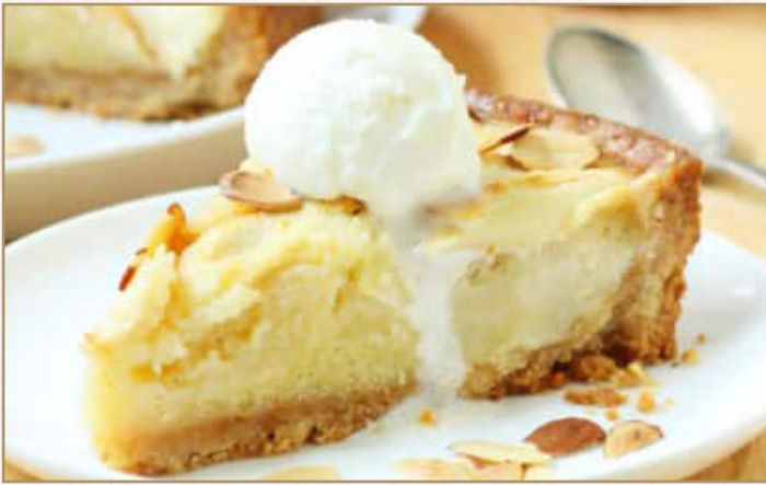
تفاح كرامبل فرانجيبيان (Calories 560) 25 SR | with ice cream 39 SR APPLE CRUMBLE FRANGIPANE 39 SR مقدم مع الكاسترد وآيس كريم الفانيليا