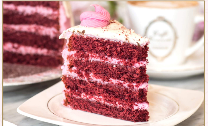
ريد فيلغت (Calories 440) 32 S.R. RED VELVET CAKE 32 S.R.