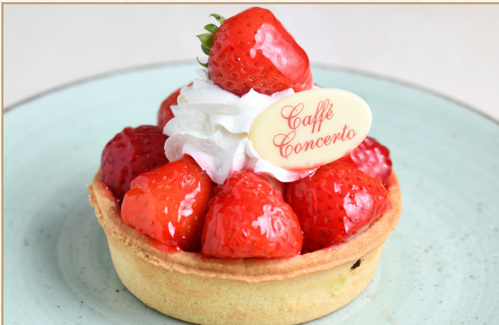
تارت الفراولة (Calories 430) 33 S.R. STRAWBERRY TART 33 S.R.