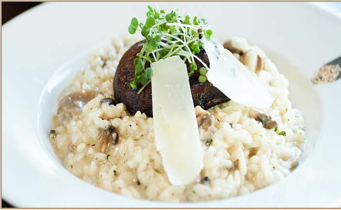
ريزوتو الفطرو بارميزان (Calories 1300) 76 S.R. RISOTTO WILD MUSHROOM & PARMESAN 76 S.R ريزوتو الفطر البري مع جبن بارميزان والتفلفل