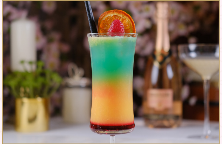
RAINBOW (Calories 850) 37 SR

Banana puree, Strawberry puree, oat milk & grenadine هريس الموز، هريس الفراولة، حليب الشوفان وجرينادين