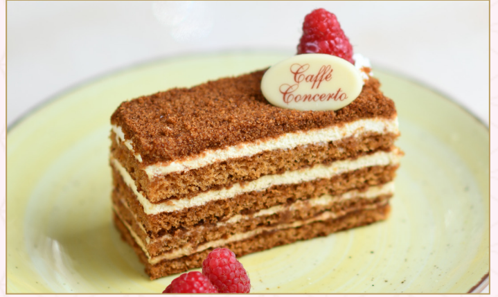
كـيكة العسل (Calories 330) 32 S.R. HONEY CAKE 32 S.R.

طبقات من الكريم الخفيف مصحوبة بإسفنجة غنية بالعسل بالكراميل