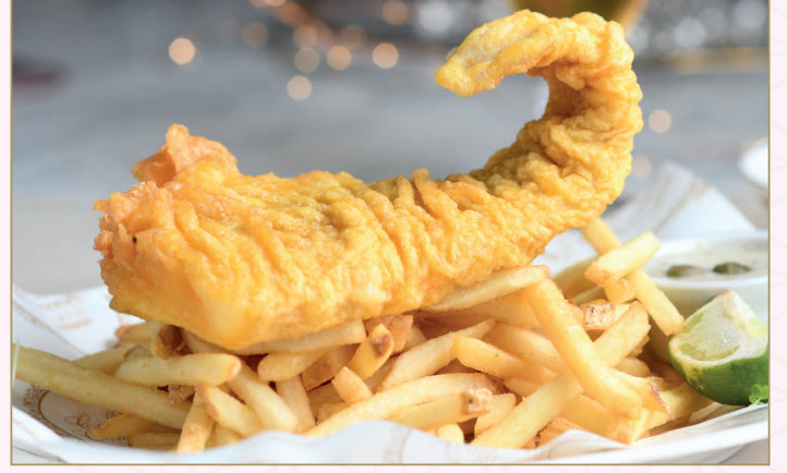
سمك وبطاطس كونشيرتو (Calories 1050) 74 S.R. CONCERTO FISH & CHIPS 74 S.R.

سمك وبطاطس كونشيرتو مع صلصة التارتار التقليدية والليمون