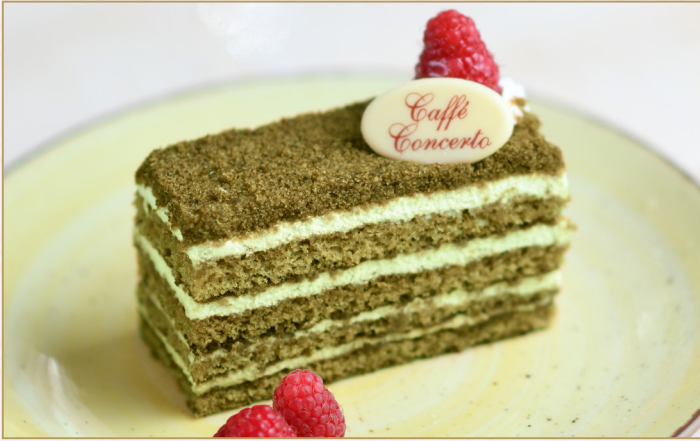
كـيكة الفستق والعسل (Calories 330) 33 S.R. PISTACHIO HONEY CAKE 33 S.R.

طبقات من الكريمة الخفيفة مع قطع الفستق المحشوة بالعسل