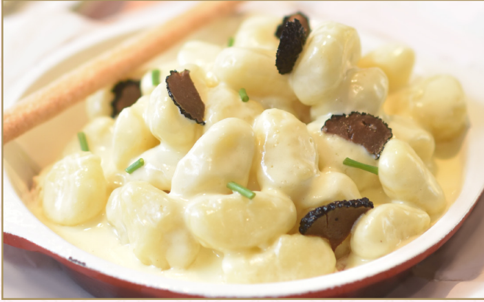
معكرونة النيوكي بالتفرفل وجبنة الفوندو (Calories 1120) 74 SR TRUFFLE GNOCCHI WITH CHEESE FONDUE 74 SR معكرونة النيوكي الغنية بالتفرفل وجبنة الفوندو