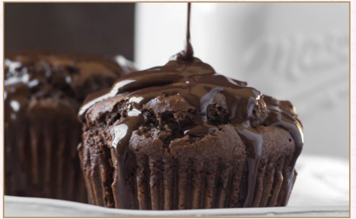
مافن الشوكولا (Calories 442) 24 SR | with ice cream 39 SR CHOCOLATE MUFFIN 24 SR تقدم مع ايس كريم