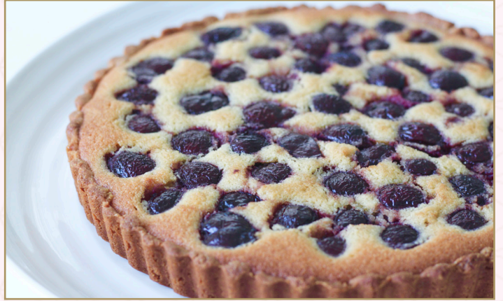
فرانجيبيان بالكرز (Calories 650) 25 SR | with ice cream 39 SR CHERRY FRANGIPANE 25 SR مع الكاسترد وآيس كريم الفانيليا