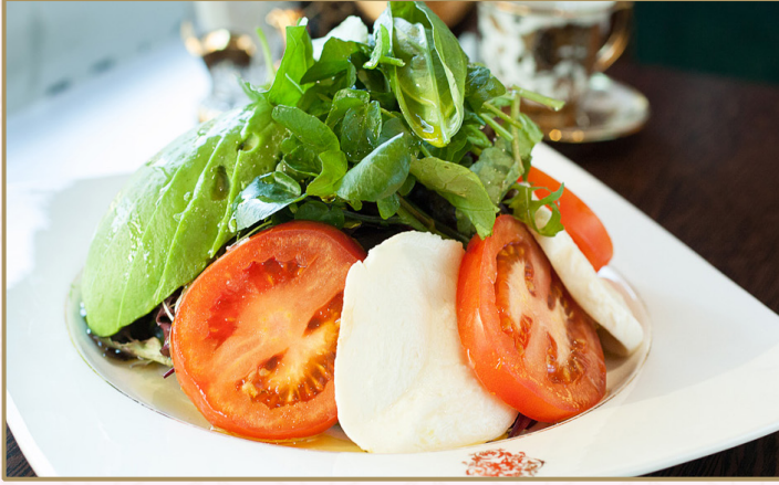
تريكولور (Calories 600) 66 S.R TRICOLORE 66 S.R

موزاريللا دي بوفالو، طماطم، أفوكادو وريحان طازج مع الجرجير و زيت الزيتون