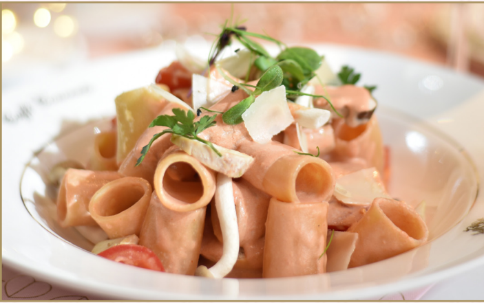
معكرونة ريجاتوني (Calories 1270) 76 S.R. RIGATONI CONCERTO 76 SR معكرونة ريجاتوني بالدجاج والفطر وصلصة الروزيه الحبق