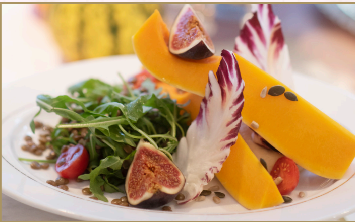
سلطة كونشيرتو (Calories 610) 69 S.R CONCERTO SALAD 69 S.R

خس مشكل مع الروكا و التين و قطع اليقطين المشوي