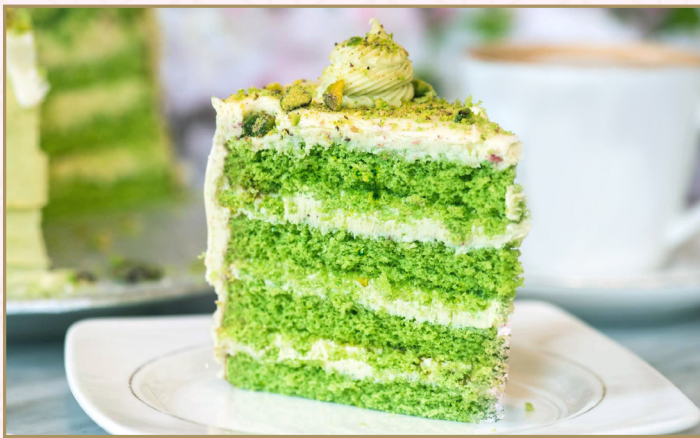
كـيك الفستق (Calories 230) 32 S.R. PISTACHIO CAKE 32 S.R.