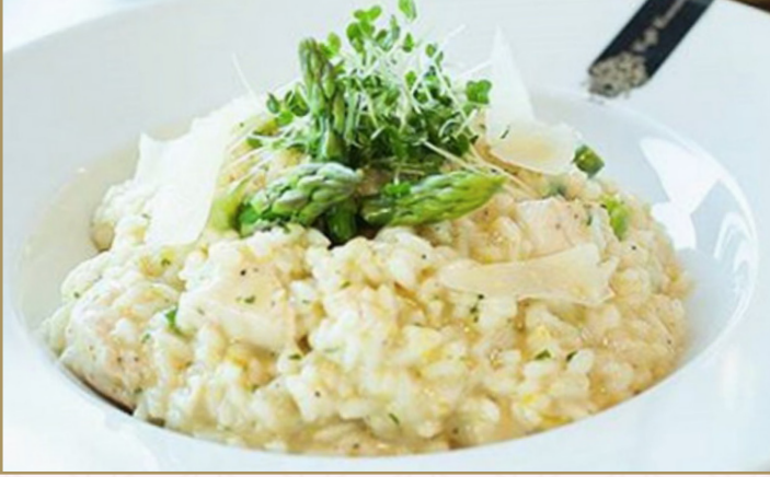
ريزوتو دجاج وفطر بري (Calories 400) 76 S.R. RISOTTO CHICKEN & WILD MUSHROOM 76 S.R مع تشكيلة من الفطر البري و البارميزان والتفلفل ريزوتو الدجاج المشوي