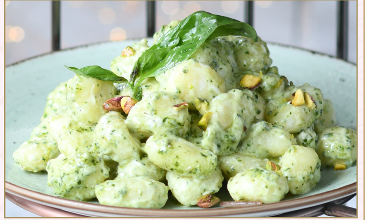
معكرونة النيوكي بصلصة البيستو (Calories 980) 74 SR PESTO GNOCCHI 74 SR معكرونة النيوكي بصلصة البيستو والكريمة والسبانخ