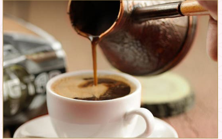
قهوة تركية (Calories 120) For one 19 S.R. | For Two 29 S.R. TURKISH COFFEE For one 19 S.R. | For Two 29 S.R. تقدم مع التمر