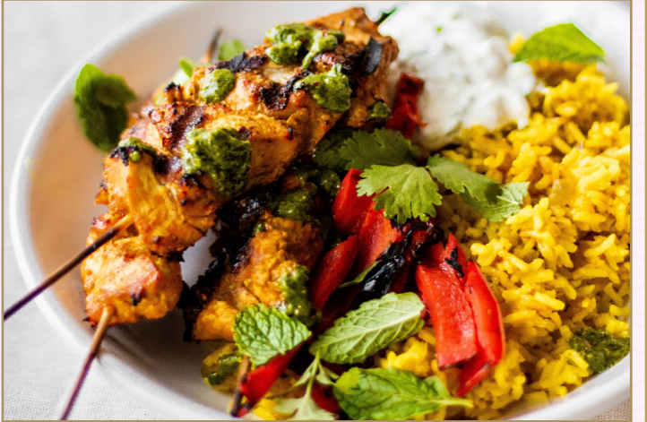
دجاج تندوري (Calories 1010) 79 S.R. CHICKEN TANDOORI 79 S.R صدور دجاج تندوري المشوية مع أرز الزعفران البسمتي