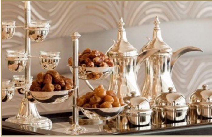
دلة القهوة العربية (Calories 120) 49 S.R. ARABIC COFFEE DELLAH 49 S.R. تقدم مع التمر