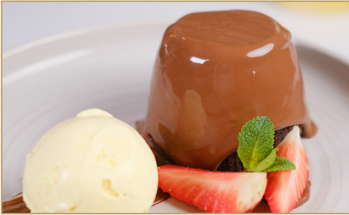
فوندان الشوكولا (Calories 650) 42 S.R. CHOCOLATE FONDANT 42 S.R.