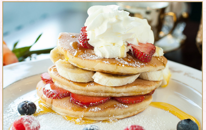
الفطائر (Calories 180) 44 SR PANCAKE 44 SR تقدم مع الفراولة الطازجة والموز والشراب

Dishes may contain Allergens! We can't guarantee our dishes are allergen free. If you have any dietary requirements, please speak to a member of Staff.