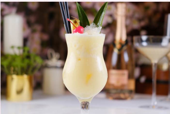
NADA COLADA (Calories 850) 37 SR

Grenadine, orange juice, lime, passion fruit puree, sprite & blue جرينادين، عصير البرتقال، الليمون، معجون فاكهة الباشن فروت، سبرايت وكوراكاو أزرق