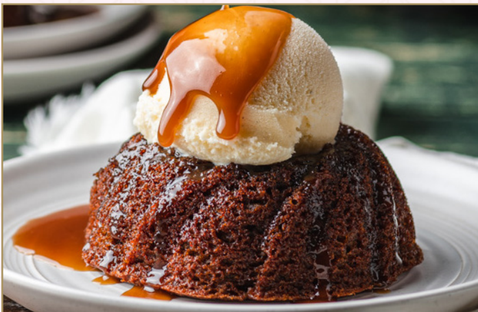
بودنج التمر (Calories 340) 48 S.R. STICKY DATE PUDDING 48 S.R.

صلصة الكراميل المالح و آيس كريم الفانيليا