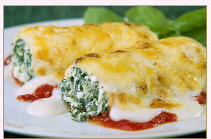
الكانيلوني (Calories 990) 76 S.R. CANELLONI 76 SR بحشوة السبانخ و جبنة الريكوتا و الموزاريلا

Dishes may contain Allergens! We can't guarantee our dishes are allergen free. If you have any dietary requirements, please speak to a member of Staff.