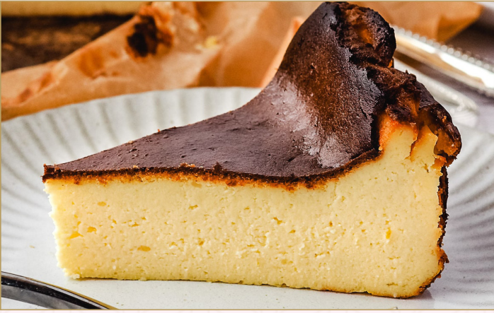
سان سيباستيان تشيزكيك (Calories 290) 32 SR SAN SEBASTIAN CHEESECAKE 32 SR