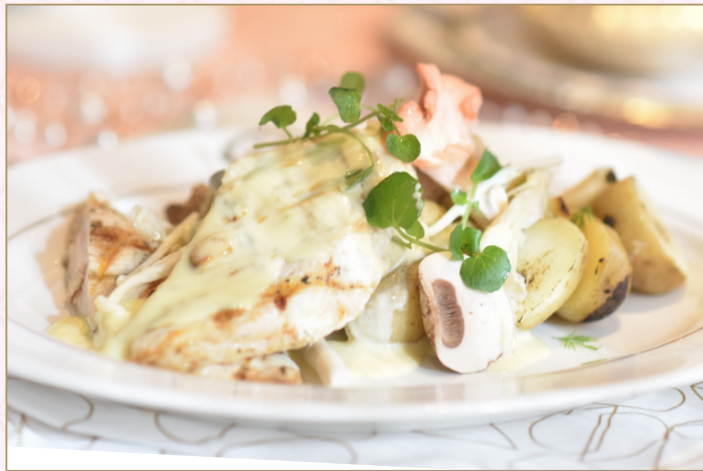
صدر دجاج مشوي (Calories 1290) 82 S.R. GRILLED CHICKEN BREAST 82 S.R صدر دجاج مشوي مع صلصة الفطر الكريمة المقدمة مع بطاطس مقلية، ثوم مهروس، فاصوليا خضراء وطماطم