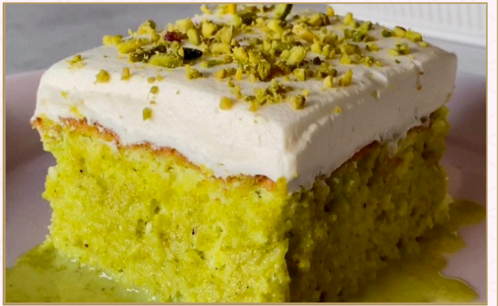
بستاشيو دولسي دي ليشيه (Calories 320) 36 S.R. PISTACHIO DULCE DE LECHE 36 S.R.