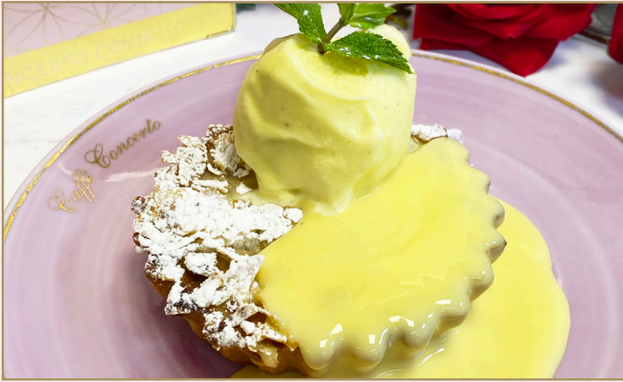
فرانجيبيان باللوز والقرفة (Calories 750) 39 SR ALMOND & CINNAMON FRANGIPANE 39 SR مع الكاسترد وآيس كريم الفانيليا