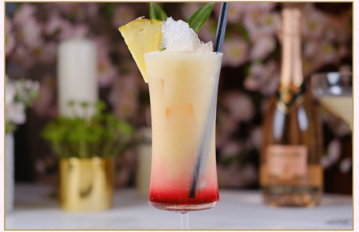
V.I.P (Calories 950) 37 SR

Apple juice, lime, brown sugar & blue curaçao عصير التفاح، ليمون، سكر بني وبلو كوراساو