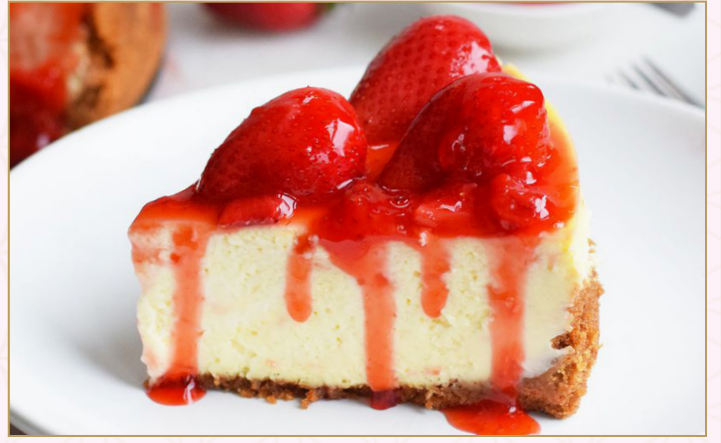
تشيز كيك الفراولة (Calories 310) 32 SR STRAWBERRY CHEESECAKE 32 SR وصفة التشيزكيك التقليدية مع الفراولة