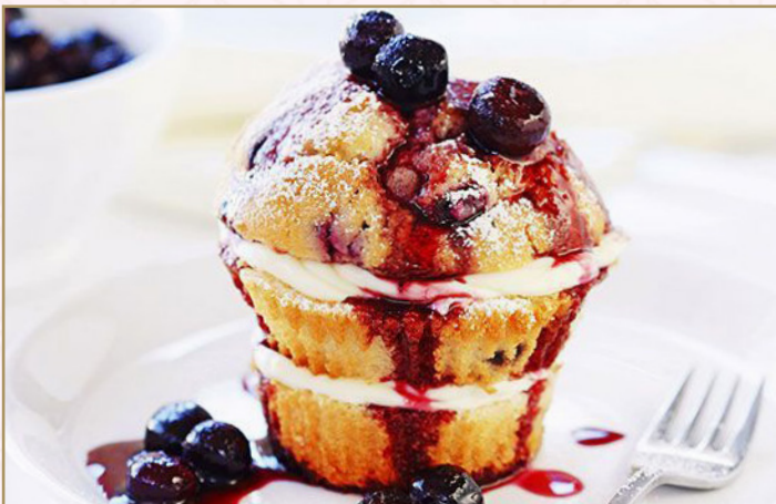
مافن التوت (Calories 377) 24 SR | with ice cream 39 SR BERRY MUFFIN 24 SR تقدم مع ايس كريم