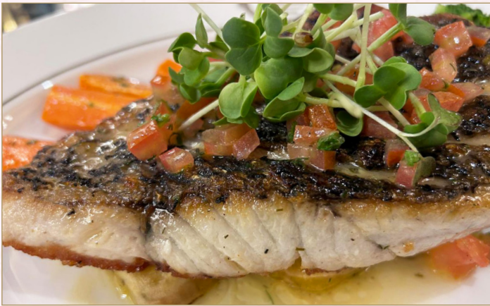
سمك القروص المشوي (Calories 1015) 109 S.R. GRILLED SEA BASS 109 S.R.

شرائح سمك السلمون المشوية مع البطاطس المقلية، سبانخ، بروكلي، شبت، كابر، وصلصة الليمون والزبدة