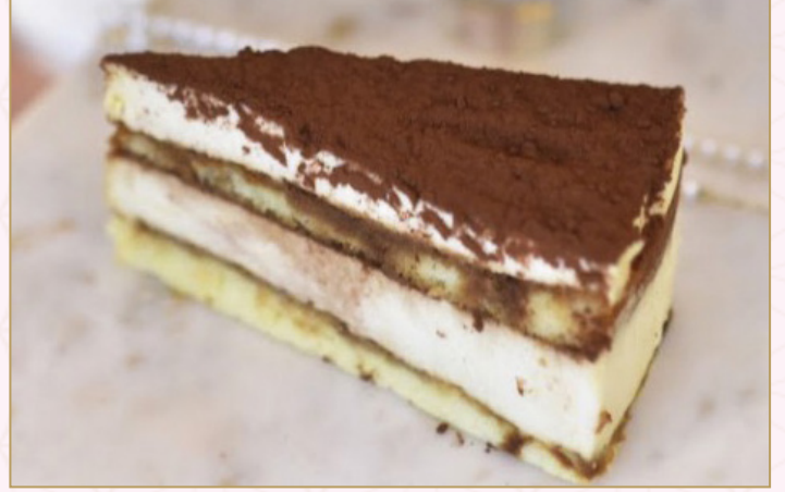
تيراميسو (Calories 320) 32 SR TIRAMISU 32 SR جينواز سبونج مشرب بالقهوة الطازجة، مع جبنة الماسكاربوني ومغطاة بالكاكاو