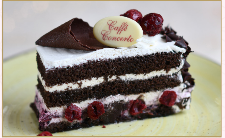
كـيكة البلاك فورست (Calories 240) 32 S.R. BLACK FOREST 32 S.R.

مع الكرز الأسود المجفف، وكيك الشوكولا، وكريمة شانتيي