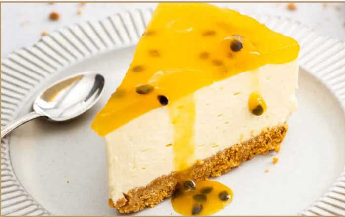
تشيز كيك باشن فروت (Calories 310) 32 SR PASSION FRUIT CHEESECAKE 32 SR