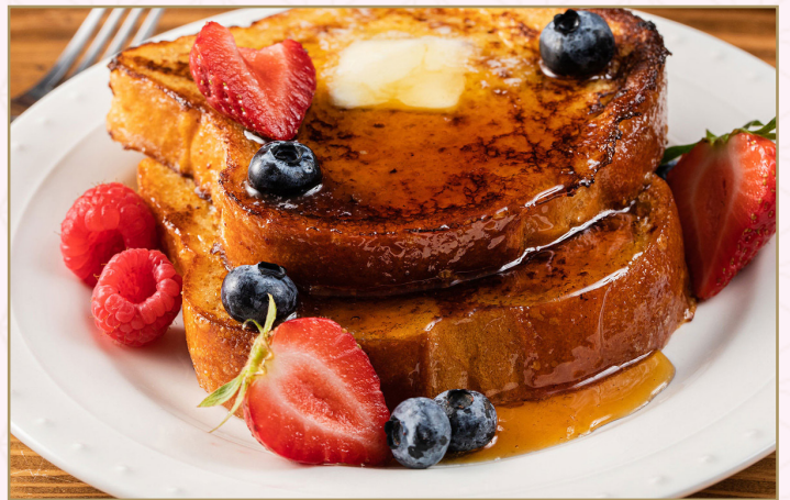
خبز فرنسي محمص (Calories 850) 52 S.R. French Toast 52 S.R.