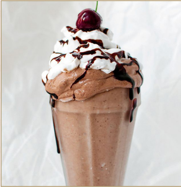
CHOCOLATE NUT SUNDAES (Calories 245) 35 SR مشروب الشوكولا بالجوز

Chocolate and Vanilla Ice Cream with whipped cream, chocolate syrup and mixed nuts