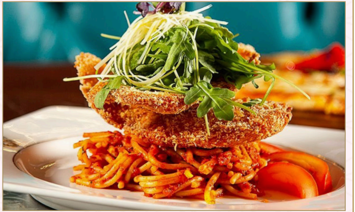
اسكالوب دجاج (Calories 1010) 79 S.R. CHICKEN ESCALOPE 79 S.R اسكالوب دجاج تقدم مع خيار من سباغيتي نابوليتانو أو أرز البسمتي بالزعفران أو بطاطس مقلية