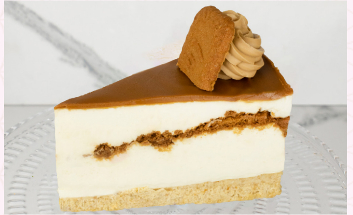
تشيز كيك بيسكوف لوتس (Calories 285) 32 S.R. BISCOFF LOTUS CHEESECAKE 32 S.R.