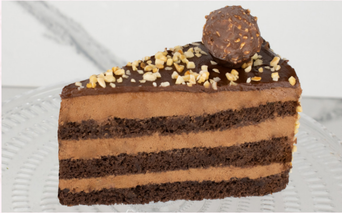
كيك فيريرو نوتشيولا (Calories 330) 32 S.R. FERRERO NOCCIOLA CAKE 32 S.R.