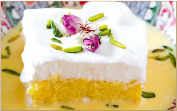
زعفران دولسي دي ليتشي (Calories 260) 34 S.R. SAFFRON DULCE DE LECHE 34 S.R.