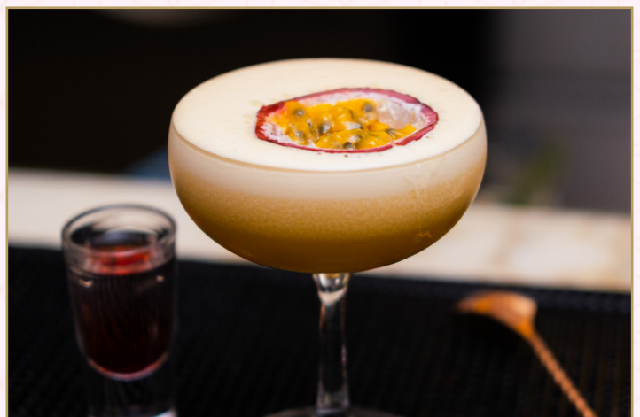
STAR MARTINI (Calories 650) 37 SR

Pineapple juice, coconut puree & coconut milk عصير الأناناس، جوز الهند وحليب جوز الهند