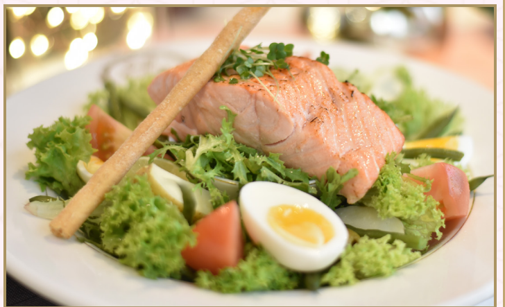
نيسواز سلمون (Calories 810) 79 S.R SALMON NIÇOISE 79 S.R

سلطة السلمون المشوي، سلطة خضراء، فاصوليا خضراء، بيض مسلوق، بطاطس، زيتون، طماطم وزيت زيتون