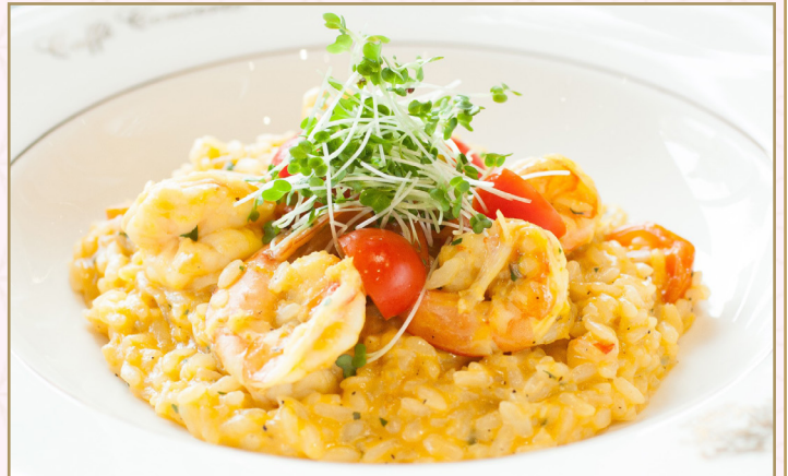
ريزوتو بالروبيان (Calories 480) 79 S.R. RISOTTO KING PRAWNS 79 S.R ريزوتو كريمي بالروبيان و شوربة مأكولات البحر