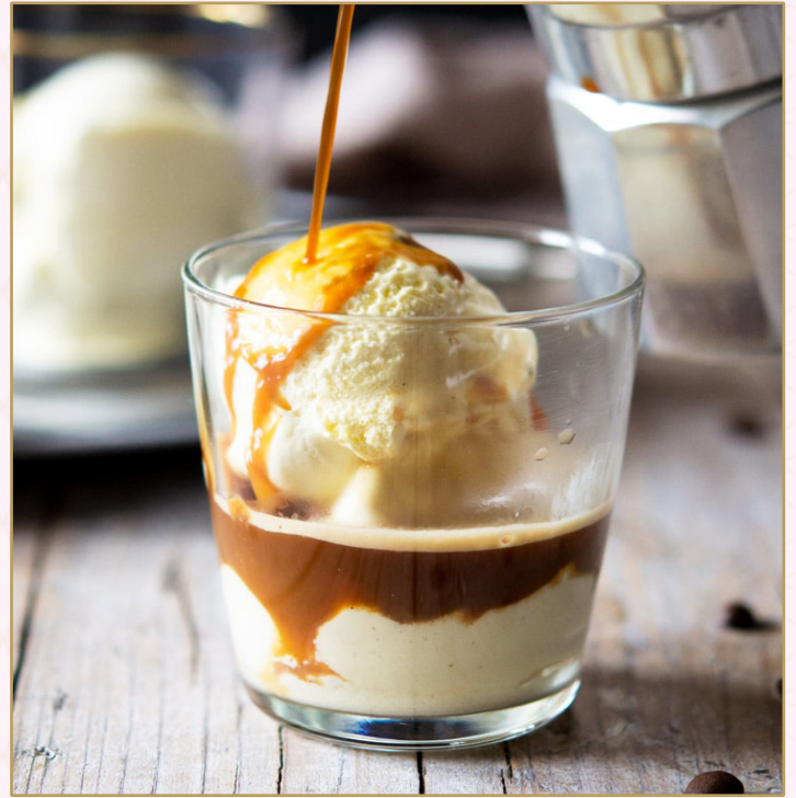
AFFOGATO (Calories 120) 32 SR أفوغاتو

آيس كريم الشوكولا والفانيليا مع كريمة مخفوقة وشراب الشوكولا والمكسرات مشكلة