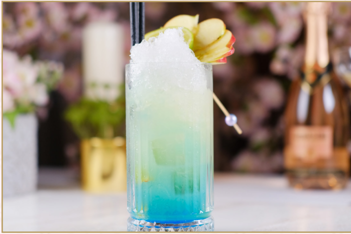
GREEN APPLE (Calories 170) 37 SR