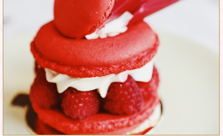
كبة الماكرون (Calories 440) 32 S.R. MACARON CAKE 32 S.R. مع صلصة التوت