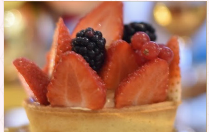
تارت الفاكهة المشكلة (Calories 430) 33 S.R. MIXED BERRIES TART 33 S.R.