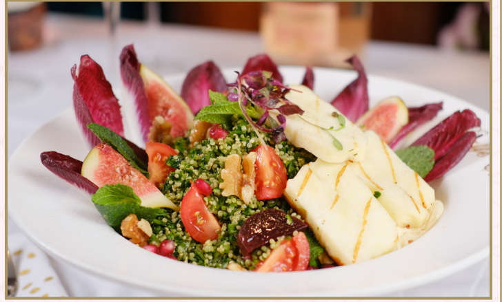
تبولة الكينوا (Calories 130) 66 S.R QUINOA TABBOULEH 66 S.R

سلطة الكينوا، البقدونس، الطماطم، الخيار وصلصة الليمون