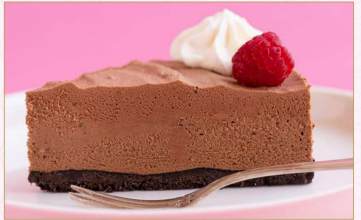
موس الشوكولاتة (Calories 330) 32 SR CHOCOLATE MOUSSE 32 SR