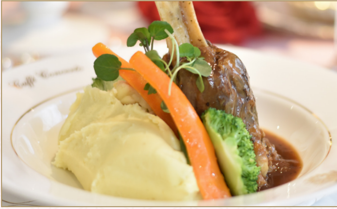
لحم خروف مشوي (Calories 2300) 109 S.R. BRAISED LAMB SHANK 109 S.R.

لحم خروف مشوي مع البطاطس المهروسة الكريمة، الخضروات المشوية والصلصة