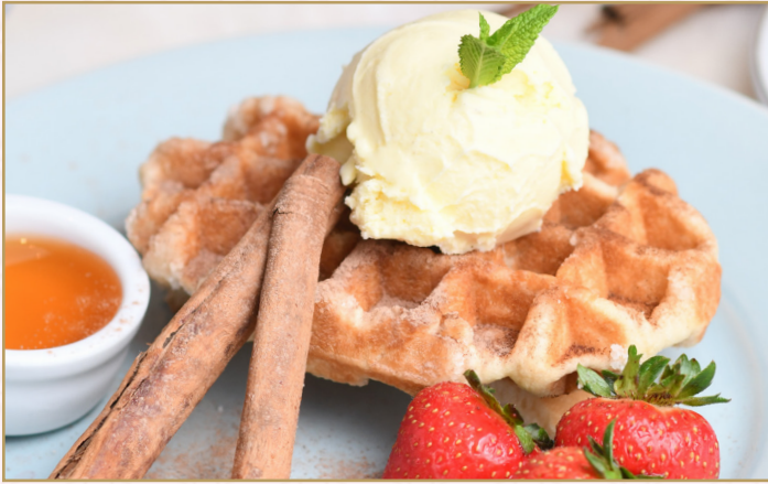
وافل بالعسل او الشوكولا (Calories 355) 45 S.R. WAFFLES 45 S.R.