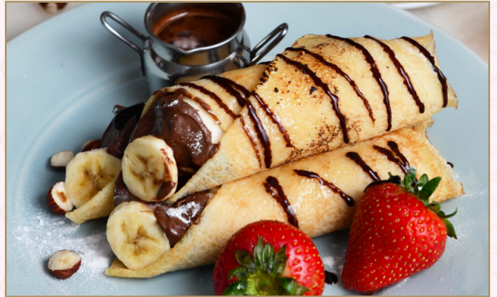
كريب (Calories 230) 45 S.R. CREPES 45 S.R.