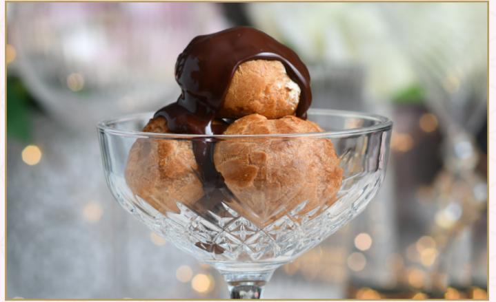
برفيتيرون (Calories 425) 42 S.R. PROFITEROLES 42 S.R.