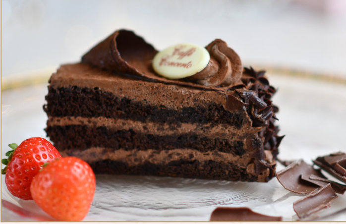
غاتو الشوكولاتة (Calories 290) 32 SR CHOCOLATE GATEAUX 32 SR مع كريمة الشوكولا و الشوكولا البلجيكية الرقيقة