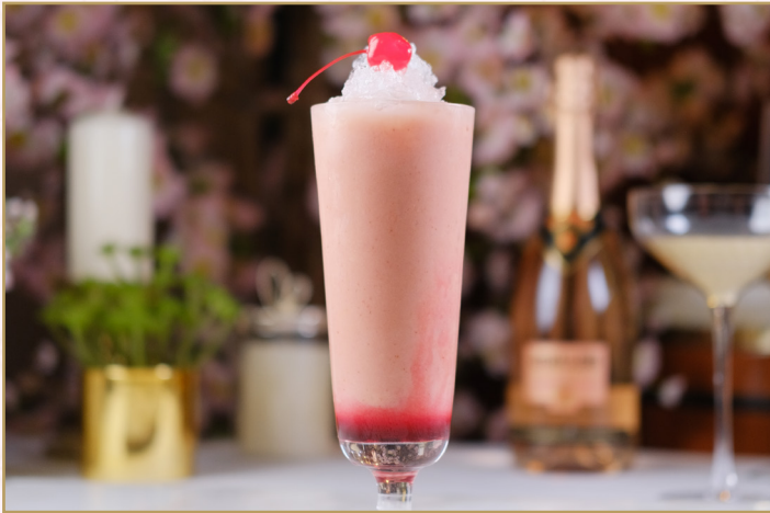
SWEET SEDUCTION (Calories 260) 37 SR

بيوري الموز، بيوري جوز الهند، بيوري فاكهة الباشن فروت، عصير الأناناس وجرينادين