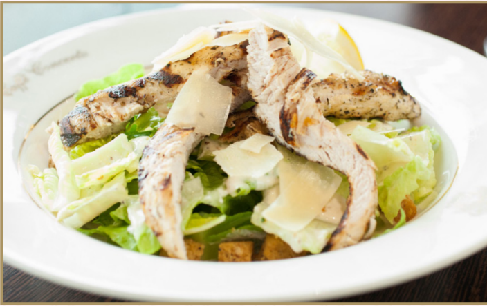
سلطة سيزر بالدجاج (Calories 450) 67 S.R CHICKEN CAESAR SALAD 67 S.R

سلطة الكينوا، البقدونس، الطماطم، الخيار وصلصة الليمون