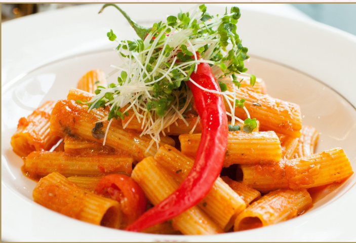
معكرونة ريجاتوني أرابياتا (Calories 990) 76 S.R. RIGATONI ARRABBIATA 76 SR معكرونة ريجاتوني أرابياتا مع صلصة الطماطم الحارة