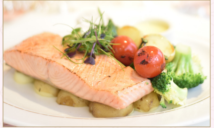
شرائح سمك السلمون المشوية (Calories 990) 109 S.R. GRILLED SALMON STEAK 109 S.R.

شرائح سمك السلمون المشوية مع البطاطس المقلية، سبانخ، بروكلي، شبت، كابر، وصلصة الليمون والزبدة