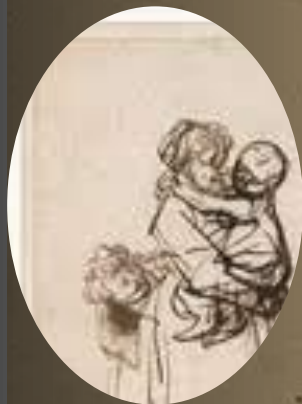
罗·阿米 (不是神的子民)