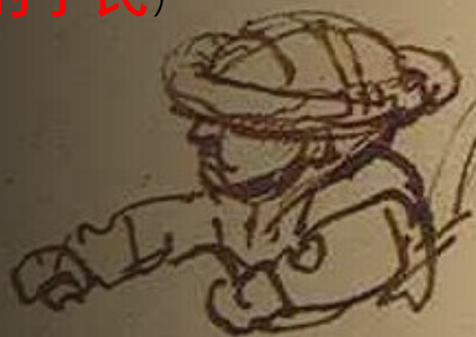
罗·路哈玛 (神不再怜悯)