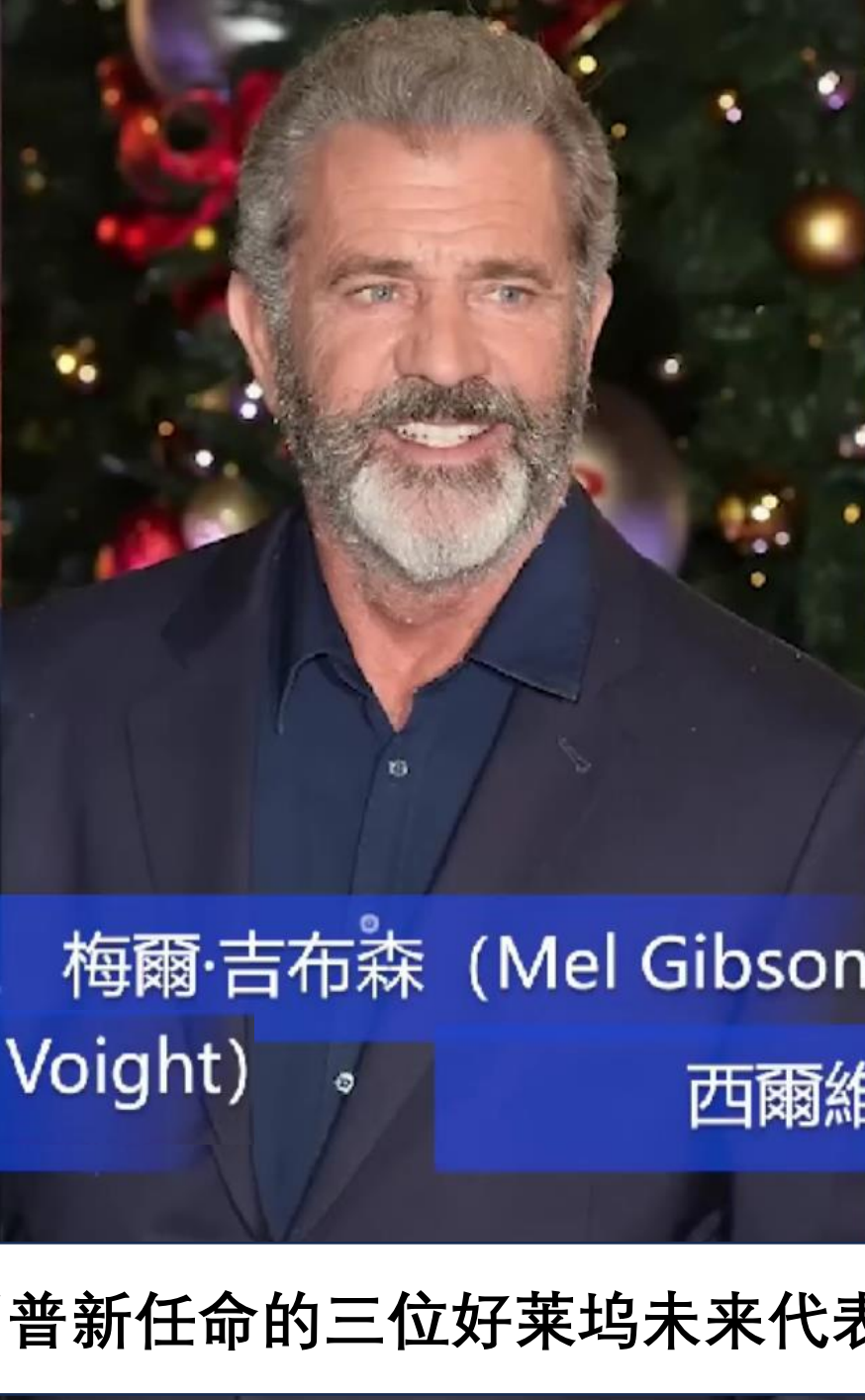
梅爾·吉布森 (Mel Gibson)