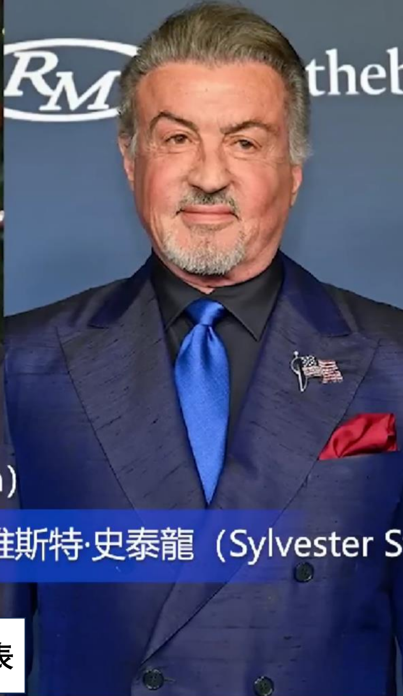
西爾維斯特·史泰龍 (Sylvester S)