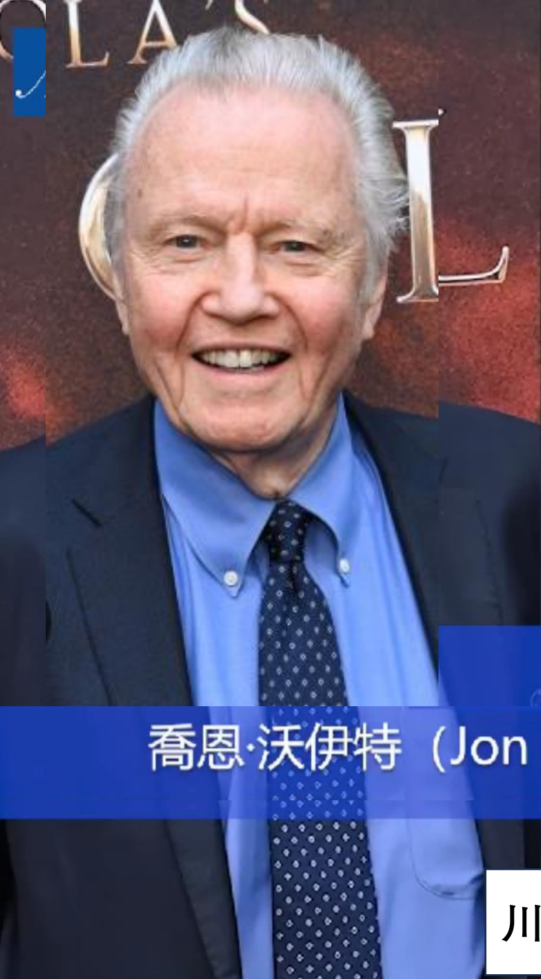
喬恩·沃伊特 (Jon Voight)