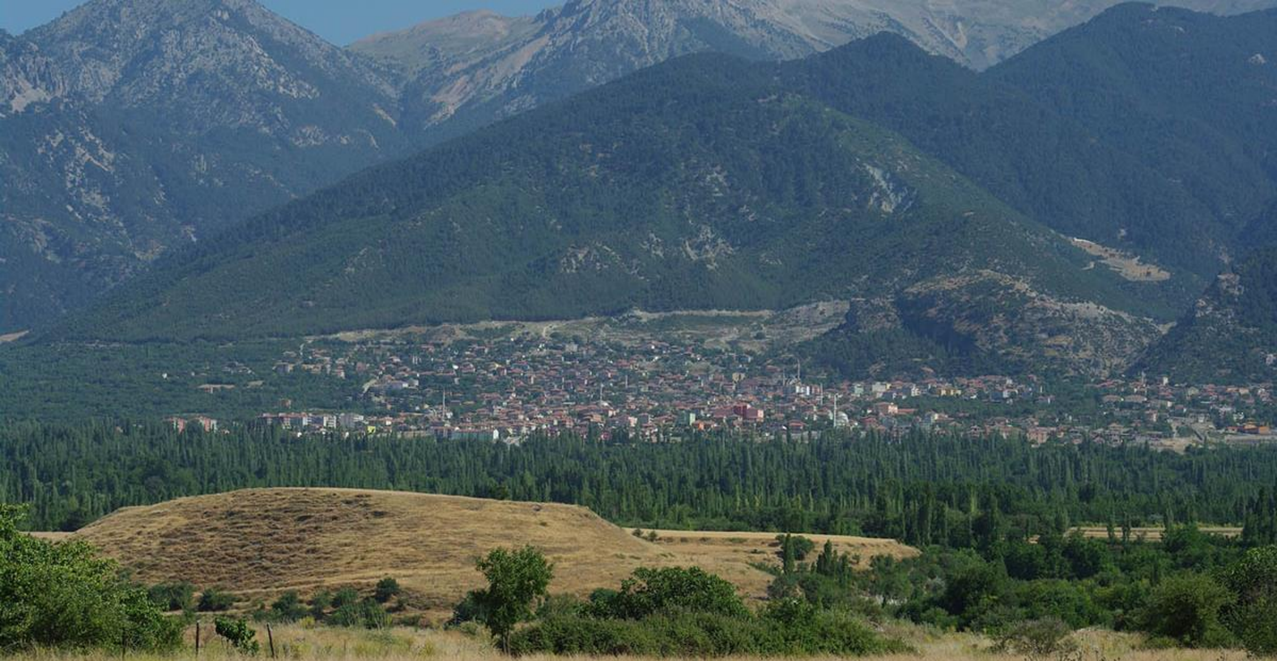
未被挖掘的歌罗西遗址，位于土耳其Cadmus山下的Honaz城附近