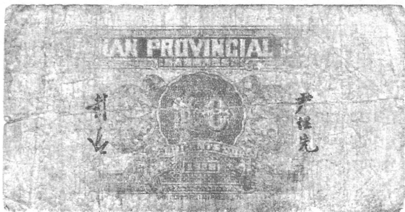
圖八 1938年兼任“湖南省銀行”行長時發行的紙幣